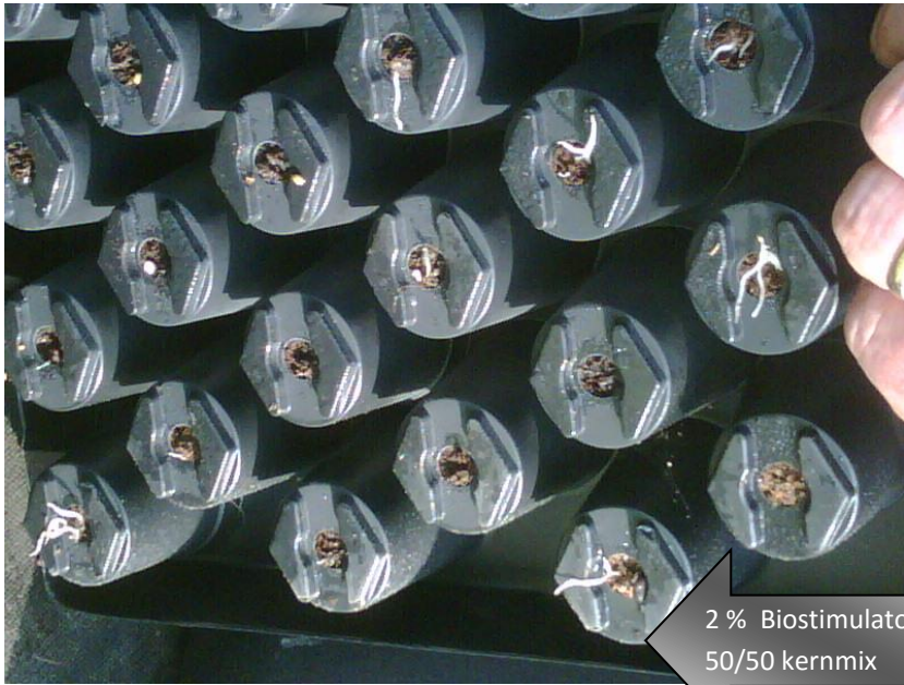
2 % Biostimulator 50/50 kernmix